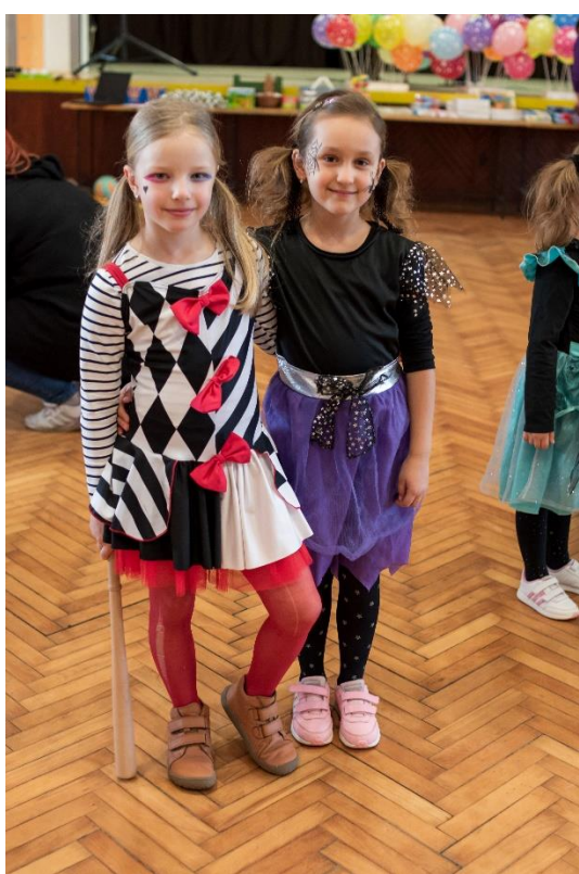
Masopustní průvod.

ROČNÍK XVIII. VYDÁNO: 6. 3. 2024. MĚSÍČNÍK ČÍSLO: 3. Uzávěrka příštího čísla: 27. 3. 2024. Evidenční číslo: MK ČR E 17544. Periodický tisk územního samosprávného celku. Vydává: Obec Oudoleň, Oudoleň 123, 582 24 Oudoleň, IČO: 00267996, DIČ: CZ00267996. Tel.: 569 642 201, 773 744 815, obec@oudolen.cz , www.oudolen.cz .