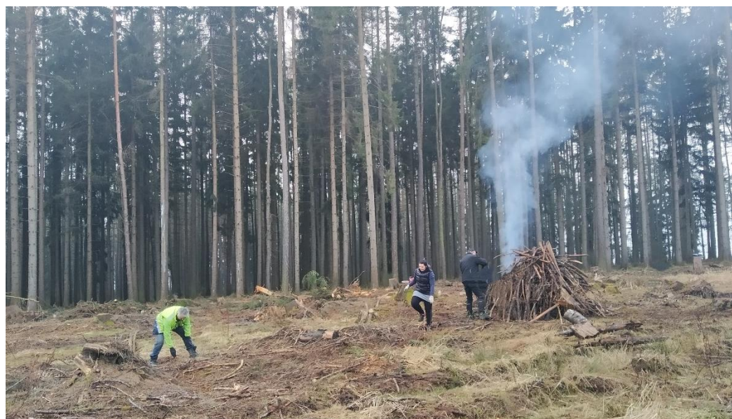
Zastupitelé obce spolu s rodinnými příslušníky čistili o víkendu obecní les.