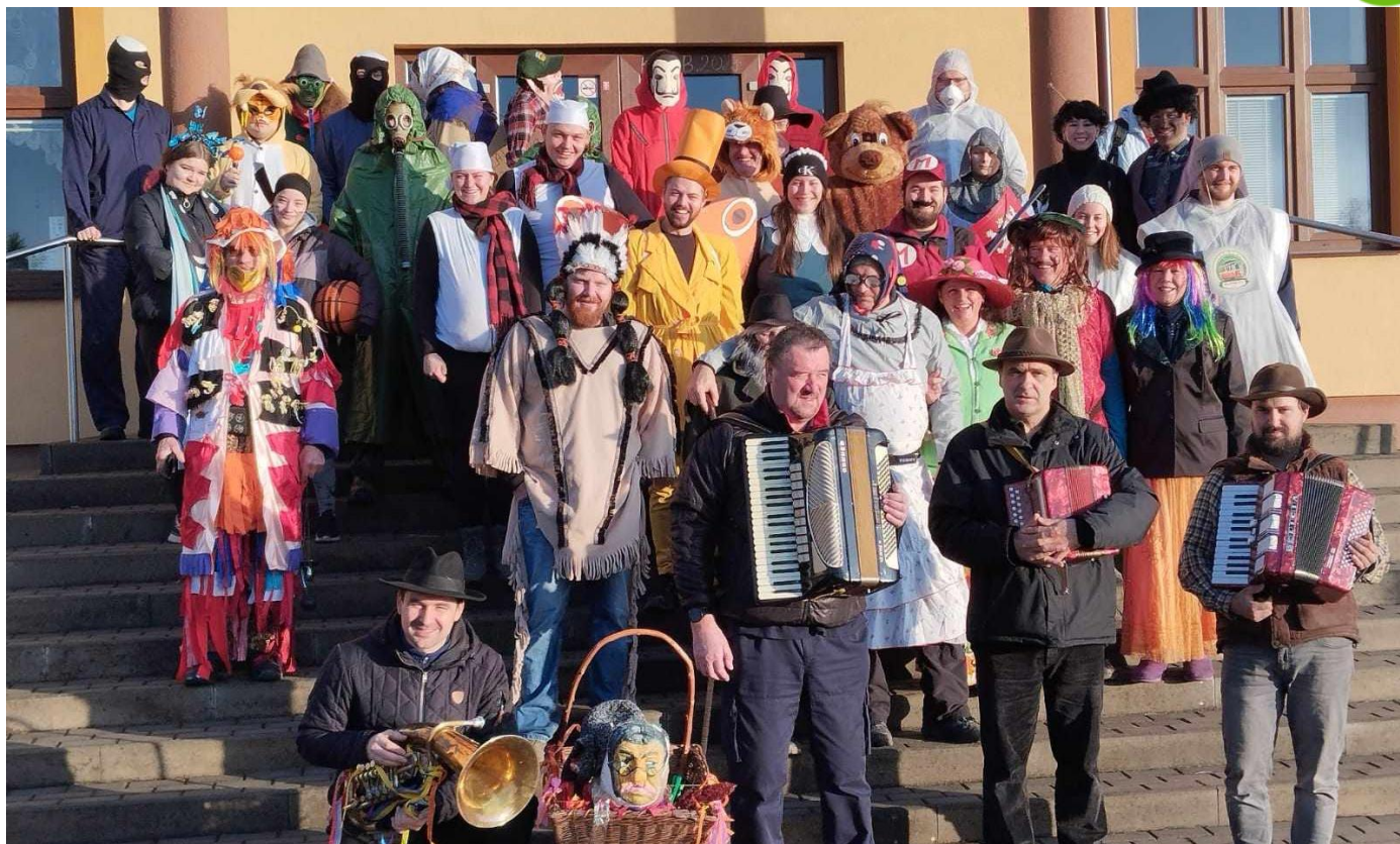
Masopustní průvod.